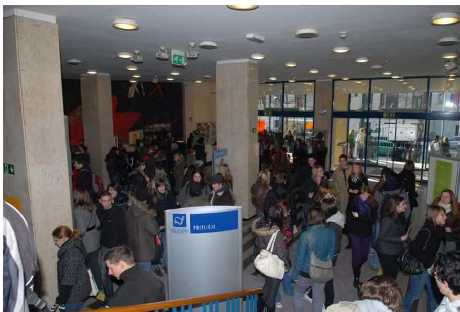
Informativni dan, 13. – 14. 2. 2009