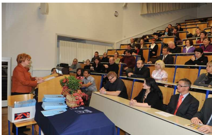
Podelitev potrdil o pridobljeni pedagoško andragoški izobrazbi, 1. 12. 2009