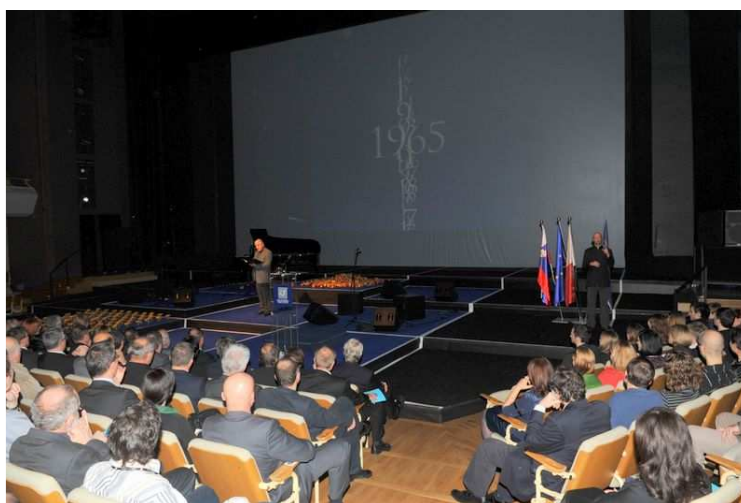
90 let Filozofske fakultete v Cankarjevem domu, 2. 12. 2009