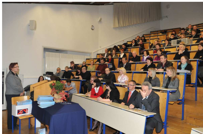
Predavalnica s 150 sedeži v pritličju fakultete

Strokovno podporo dejavnostim fakultete nudijo skupne strokovne službe in tajništva oddelkov.