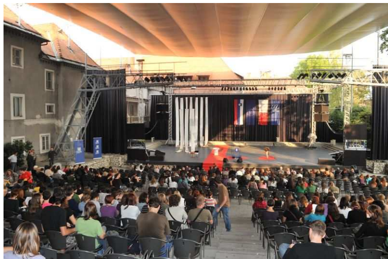
Podelitev indeksov 2009 v Križankah, 2. 10. 2009