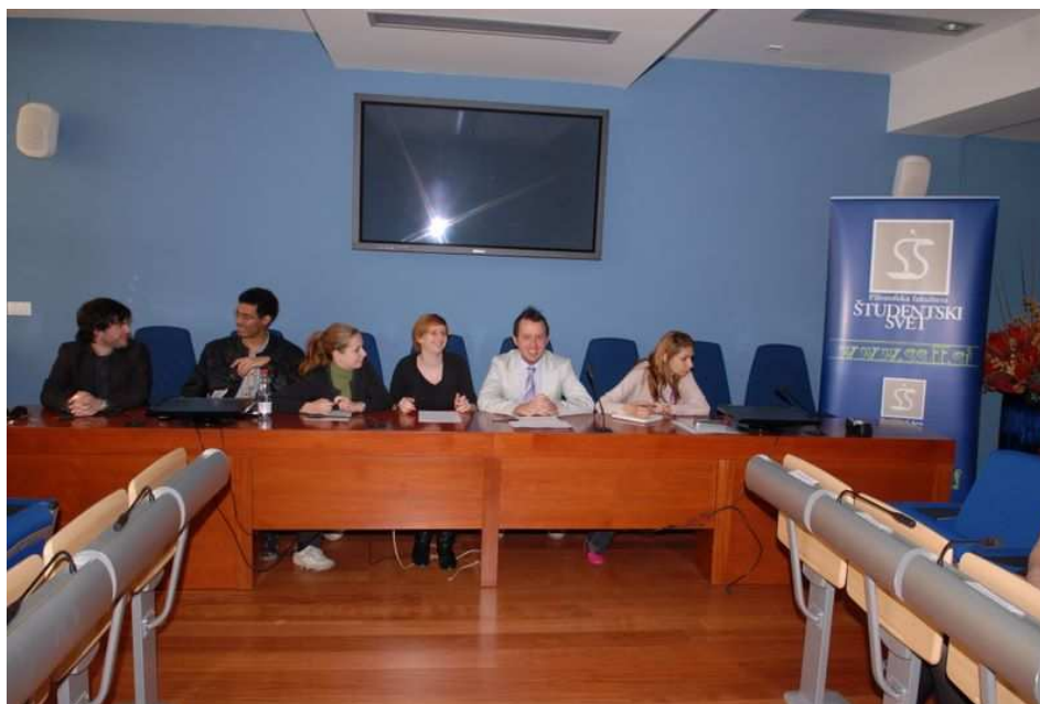
Slavnostna seja ŠS FF, 16. 3. 2009