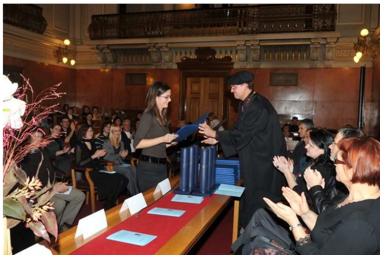
Podelitev priznanj FF in študentskih Prešernovih nagrad, 26. 11. 2009