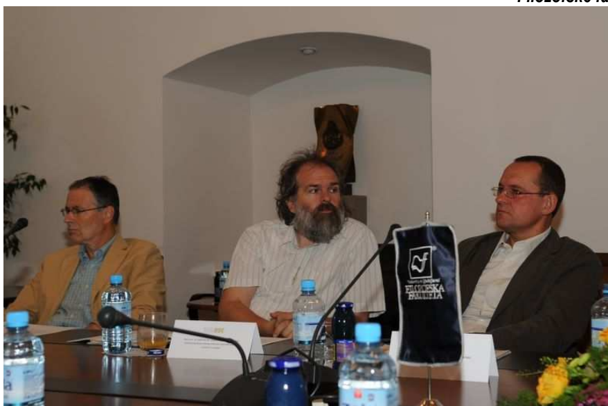
Novinarska konferenca »Noč raziskovalcev 2009, 17. 6. 2009

2009 NOČ RAZISKOVALCEV HUMANISTIKA: TO SI TI.