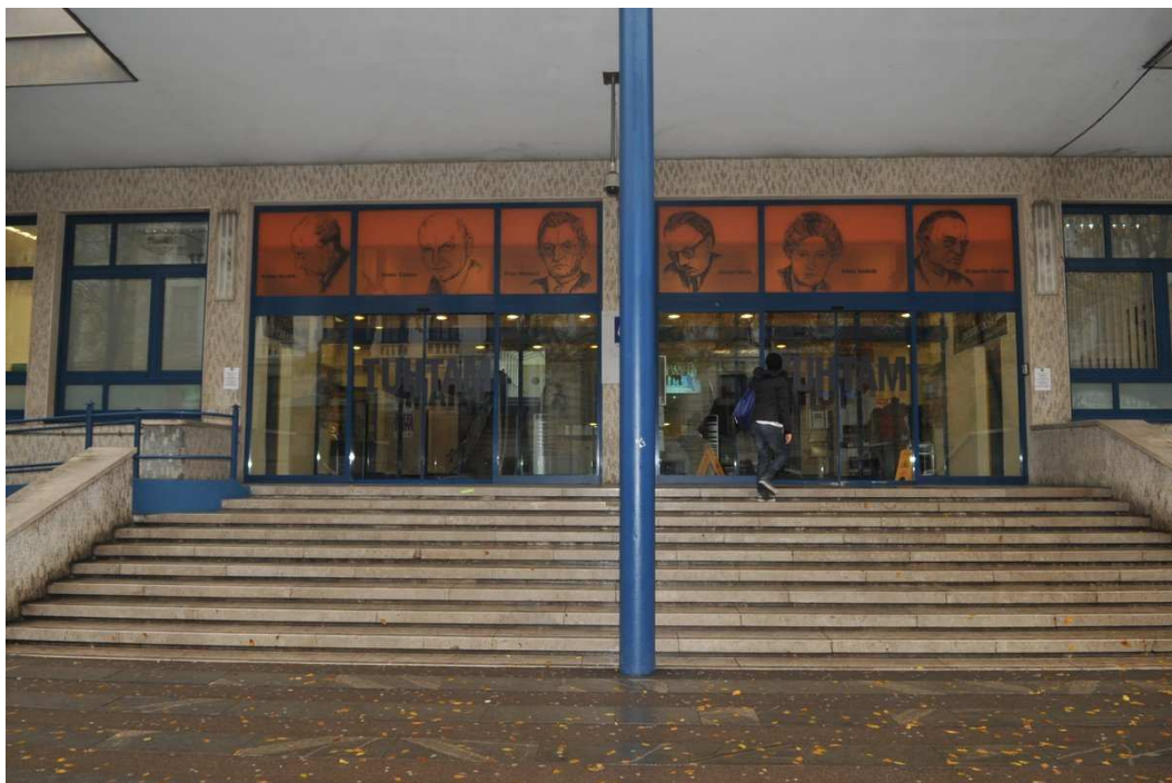
Stopnišče pred Filozofsko fakulteto