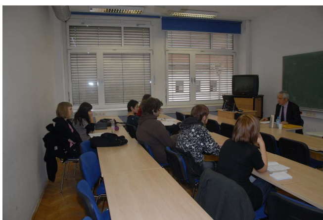
Predavalnica z 20 sedeži v 3 nadstropju